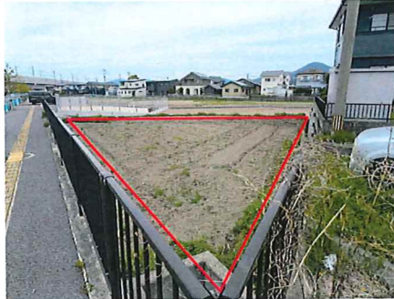
現況写真 工事後のお引渡し