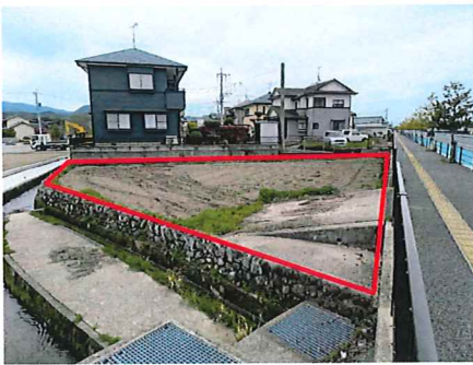
現況写真 工事後のお引渡し